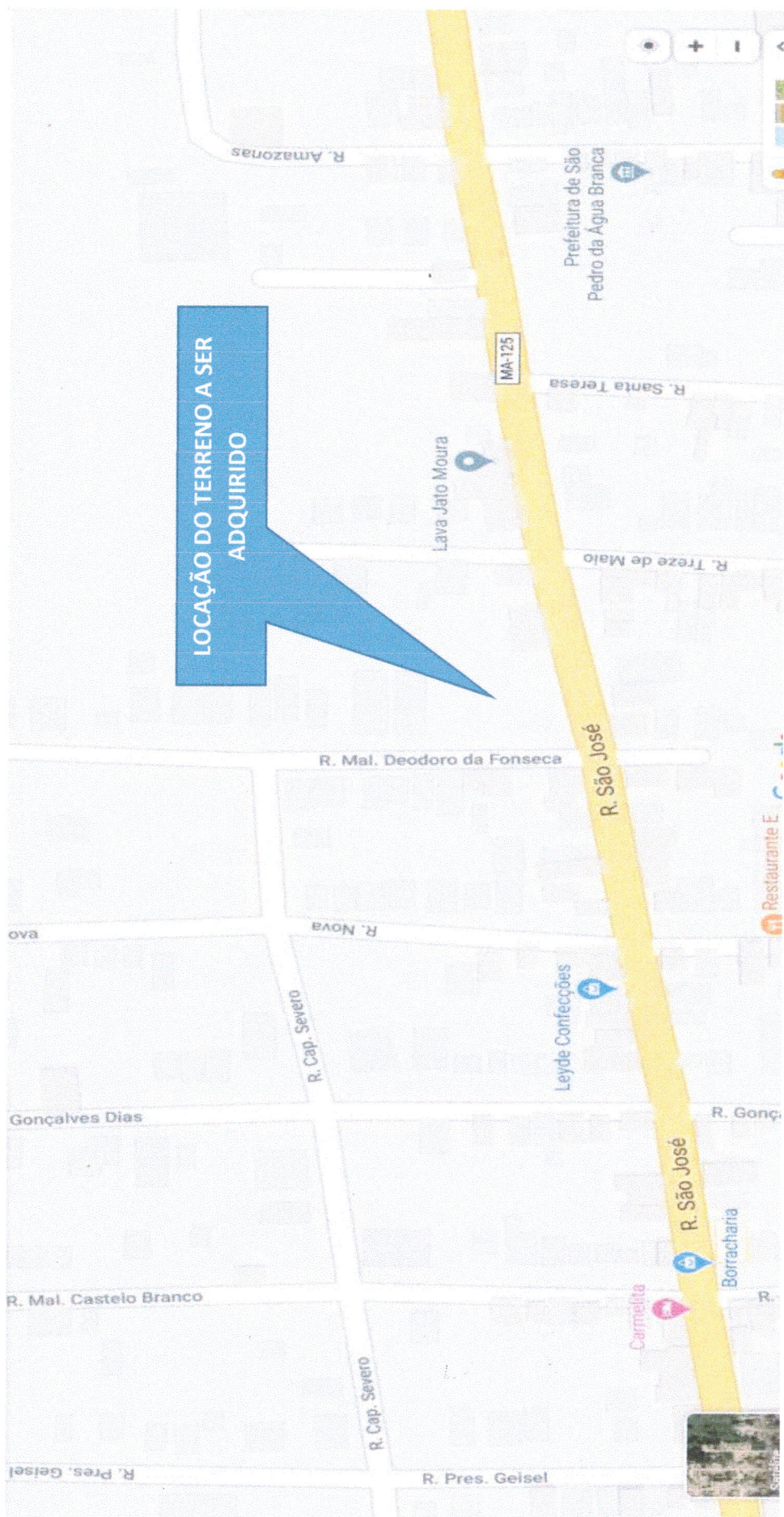
LOCAÇÃO DO TERRENO A SER ADQUIRIDO PARA IMPLANTAÇÃO DA CRECHE E DO PRÉDIO ADMINISTRATIVO DA SEMED